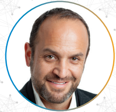
Relatore: Howard Gluckman

Il Dr. Gluckman, massimo esperto della PET, illustrerà la filosofia alla base di questo protocollo senza trascurare gli aspetti pratici e sarà disponibile al termine della relazione per un brain storming collettivo di sicuro grande interesse.