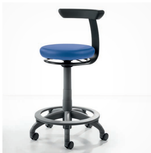
Carl Manual Plus

Sitzhöhenverstellung per Hand, mit Fußring