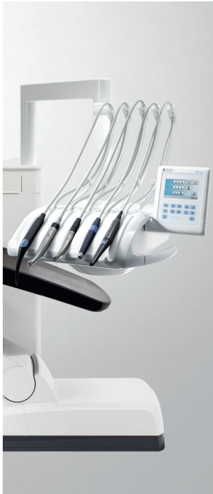
Sinus CS mit Schwingbügel