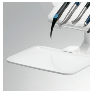
Schwenkbare Trayhalter für 2 Normtrays