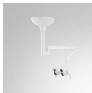
LEDview Plus Deckenmodell