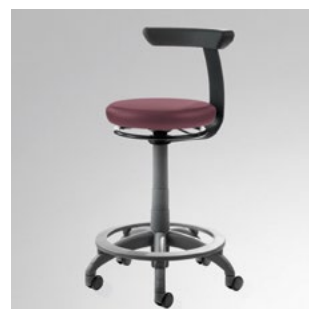
Carl (Manual Plus)