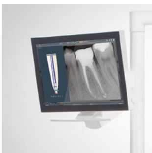
Monitor, 22", an der Leuchtaufbaustange