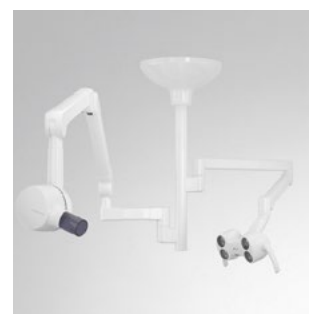
Deckenkombination mit Heliodent Plus