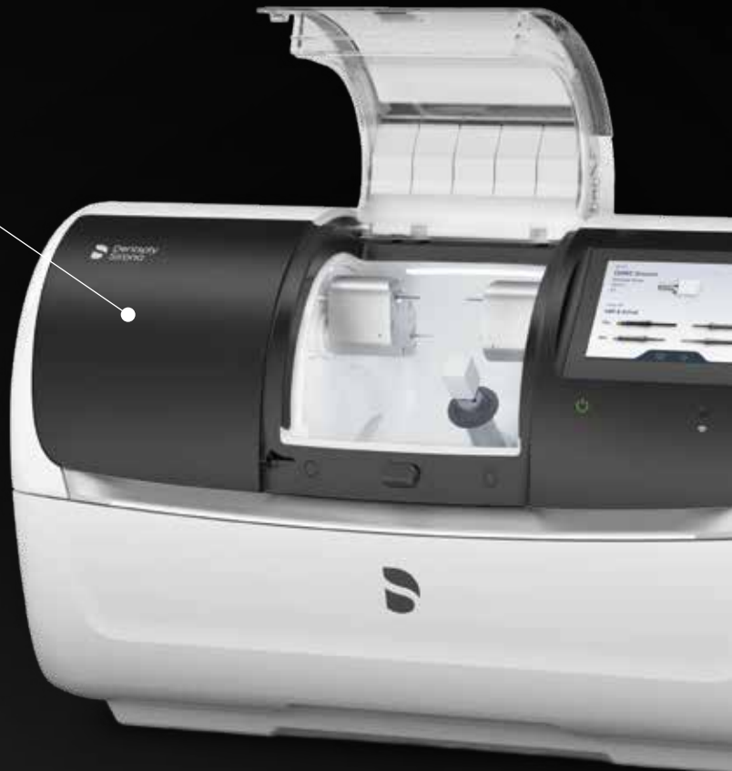
CEREC MC XL

Unsere bisher schnellste Schleif- und Fräseinheit kann hervorragende Zirkonoxidkronen in weniger als 5 Minuten herstellen. Sie kann auch Glaskeramik viel schneller als das Vorgängermodell schleifen. Das Ergebnis: Zufriedene Patienten und eine hohe Produktivität.