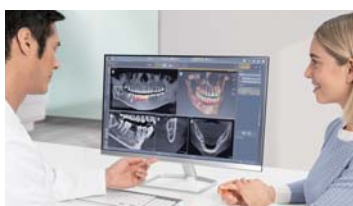
画像診断ソフトウェア「SIDEXIS 4」

直感的でわかりやすいインターフェース。画像を一画面で表示させることで、患者さんにも説明しやすく、コンサルテーションツールとしても活用できます。