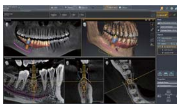
インプラントプランニングソフトウェア「SICATインプラント」

直感的でわかりやすいインターフェース。画像を一画面で表示させることで、患者さんにも説明しやすく、コンサルテーションツールとしても活用できます。