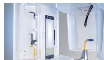
キャビネット・コスミックライト

バイトブロックの角度により最適な咬合平面を認識。電動の三点式ヘッドサポートハンド、位置決めEVIビームライトなどにより画像再現性を高めます。