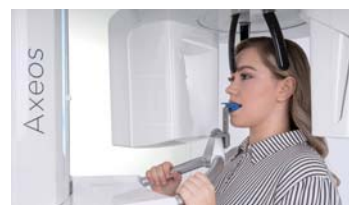
確実なポジショニング

ボタン・シンボルがわかりやすく並んでいるため、操作が簡単。パッド自体はX線室の状況に合わせてフレキシブルに回転・角度調整が可能。