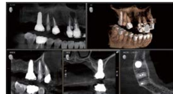
アーチファクトを大幅軽減「MARS」

2DのX線と同じ線領域にて3D撮影が可能。画像処理により、低減された線量でも骨のような骨密度の構造を画像として収集、歯列矯正やインプラント治療の領域においても便利かつ効果的に使用できます。