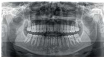
パノラマテクノロジー「DCSセンサー」

Direct Conversion Sensor(DCS)を用いたパノラマX線撮影。X線が電気信号に直接変換されるため、従来のシステムのような光変換に伴う信号ロスが生じず、精細度の高い画像が得られます。