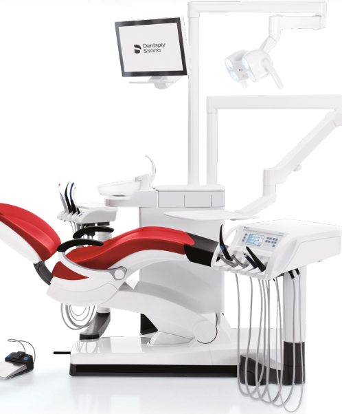
一般的名称：歯科用ユニット 販売名：シロナ SINIUS 認証番号：224AABZ100065000 管理 特管