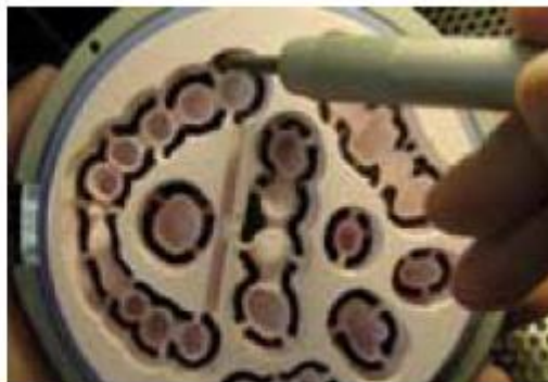
Figure 4: Sandblasting the workpieces.