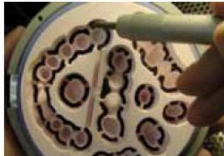
Figure 4: Sandblasting the workpieces.