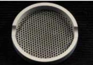
Figure 3: Sandblasting aid.

주둥이 바닥부분의 초과된 가장자리를 다듬어야 함으로써 소결블럭에 더 안정적인 물체를 줄 수 있다.