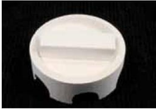
Figure 1: Sintering tray with sintering block.

2 개 wide-span bridge(8 이상 units)는 Cercon heat plus 에서 동시에 소결될 수 있다. 기계적 구속없이 수축을 돕기 위한 그림 1 물체와 Cercon heat plus(130mm) 내부 수직 여유공간을 적당히 생각하여, 소결블럭에 물체를 둔다. (그림 1 과 2)