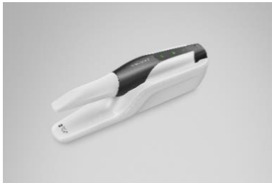
Fig. 1: Primescan 2: La primera solución de escaneo intraoral nativa en la nube

disponibles para su Descarga en el sitio web.