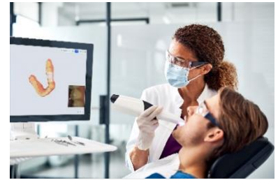
Fig. 3: Primescan 2 cuenta con un diseño elegante y equilibrado con una punta más estrecha, que permite un fácil acceso a los molares o a las superficies distales.