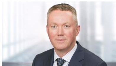
Fig. 5: Simon Campion, Presidente y CEO de Dentsply Sirona