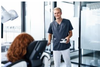
Fig. 4: Primescan 2 es de uso intuitivo. El escaneo se puede delegar fácilmente dentro del equipo.