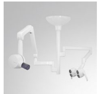
Deckenkombination mit Heliodent Plus