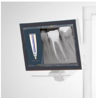
Monitor, 22", an der Leuchtaufbaustange