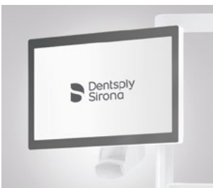
Monitor, 22", an der Leuchtenaufbaustange