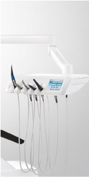
Intego Pro TS mit Schwebetisch