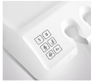
Bedienpaneel Assistenz- element