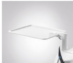
Zusatztray für 2 Normtrays