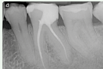
Контроль через 14 месяцев показал улучшение рентгенопрозрачности периапикальной области