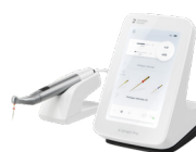
6779008 X-Smart® Pro Эндомотор

Эндомотор X-Smart® Pro+ со встроенным апекслокатором, мини угловой наконечник со встроенным светодиодом, регулируемый на 360° корпус рукоятки наконечника из нержавеющей стали, магнитный держатель рукоятки наконечника, коробка для принадлежностей (зарядное устройство с универсальными адаптерами питания), загубник с кабелем, клемма для файлов с кабелем, Y-соединительный кабель (адаптер апекслокатора)