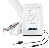
6779016 X-Smart® Pro+ Эндомотор со встроенным апекслокатором

Эндомотор X-Smart® Pro+ со встроенным апекслокатором, мини угловой наконечник со встроенным светодиодом, регулируемый на 360° корпус рукоятки наконечника из нержавеющей стали, магнитный держатель рукоятки наконечника, коробка для принадлежностей (зарядное устройство с универсальными адаптерами питания), загубник с кабелем, клемма для файлов с кабелем, Y-соединительный кабель (адаптер апекслокатора)